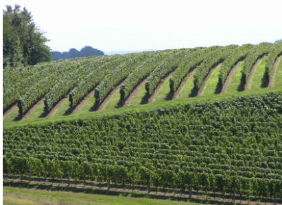
Die Domaine Maouries, Labarthète besitzt sowohl in der AOC Madiran als auch in der angrenzenden VDQS Côtes de Saint-Mont Weinberge

Béarn hat, soweit es Rotweine aus Tannat betrifft, zur Zeit keine wirklich erwähnenswerten Winzer aufzuweisen. In Tursan ragt das Château de Bachen von Michel Guérard und die Cooperative in Geaune aus der Masse einfacher, meist sauberer Weine heraus. Die Cooperative erhielt sowohl 2004 als auch 2005 im Concours de Bordeaux eine Silbermedaille.