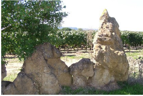
Die Lage "les menhires", Château Bouscassé, AOC Madiran