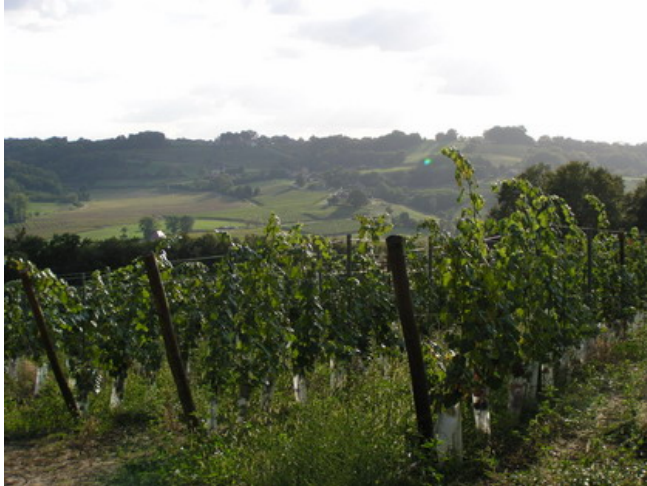
Hügel im Pyrenäenvorland prägen die AOC Madiran

Ab 1850 fegte über Frankreichs Südwesten mit seinen traditionellen Tannat-Anbaugebieten der aus Amerika eingeschleppte falsche Mehltau hinweg und danach kam die Reblauskatastrophe. Bevor sich Winzer und Rebflächen erholten hatten, kamen der deutsch-französische Krieg, dann der erste und der zweite Weltkrieg. Von den Schäden durch Natur und Kriegsfolgen erholte sich der Weinbau im Südwesten erst nach dem zweiten Weltkrieg. Heute stehen in Frankreich ca. 2500 ha Rebfläche unter Tannat. Etwa 3800 ha sind es in Uruguay. In Argentinien, Australien, Brasilien, Chile, Italien, Neuseeland und USA gibt es ebenfalls einige Hektar. In Kalifornien, Georgia und insbesondere in Virginia nimmt die Anbaufläche für Tannat sogar zu. In Deutschland wächst kein Tannat, aber in Österreich (Mittelburgenland) und der Schweiz (Tessin, Wallis) gibt es Versuchsanbauflächen und einige wenige Winzer verwenden Tannat in ihren Rotweincuvées.